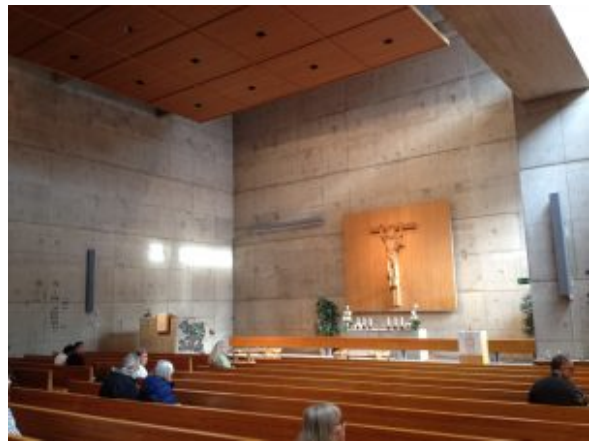
Ihmisiä Järvenpään kirkossa sunnuntaina 18.3.

Ulkonäkö muistuttaa enemmän pommisuojaa.