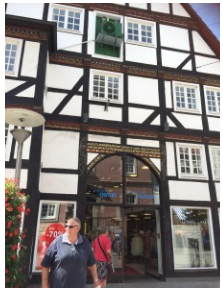
Das Fachwerkhaus (ristikkotalo)

Alussa kohtasin hieman vaikeuksia ikkunoiden kanssa. Ne voi avata kokonaan auki tai laittaa "auf kipp" asentoon, jolloin ikkuna on auki vain ylhäältä. Taistelustani ikkunan kahvan kanssa on joutunut kärsimään yksi kukkaruukku.