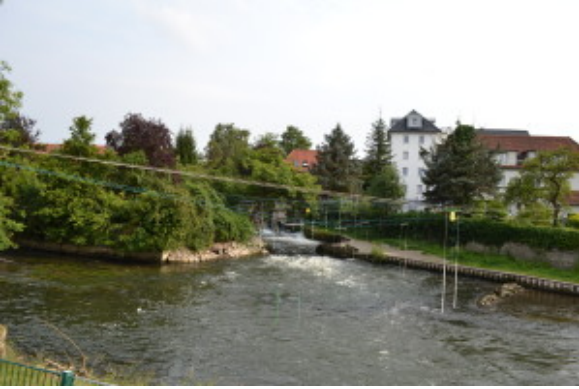
Kouluni pihalla kuohuu koski

Koulussa aineiden haastavuus on melko samalla tasolla kuin Suomessa. Oppilaat eivät saa kuitenkaan vaikuttaa oppiaineisiinsa yhtä paljon kuin Suomessa, eikä aineita suoriteta kurseittain. Sama lukujärjestys pysyy siis koko lukuvuoden voimassa. Tunneilla on täällä enemmän keskustelua ja esityksiä, mutta tietotekniikkaa ei käytetä kovin paljon hyödyksi. Ruokatunnilla syödään eväitä, mennään kotiin tai ostetaan jotain pientä koulun kioskista. Maksullisen kouluruuan skippaavat lähes kaikki, sillä huhujen mukaan se ei ole kovin herkullista.