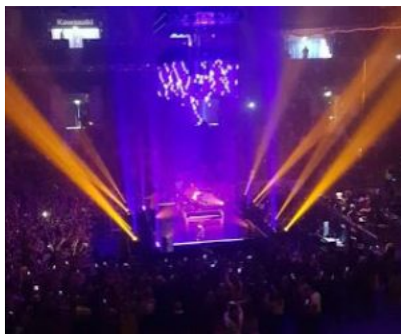
Twenty One Pilots soitti muutaman kappaleen niin sanotulla "kakkoslavalla".

Koko keikan ajan palavat autot, soihdut, erilaiset valot, savukoneet, videot sekä animaatiot loivat huikean tunnelman saliin. Yhtyeellä oli ison lavansa lisäksi pienempi lava, jonne he siirtyvät soittamaan muutaman kappaleen ajaksi.